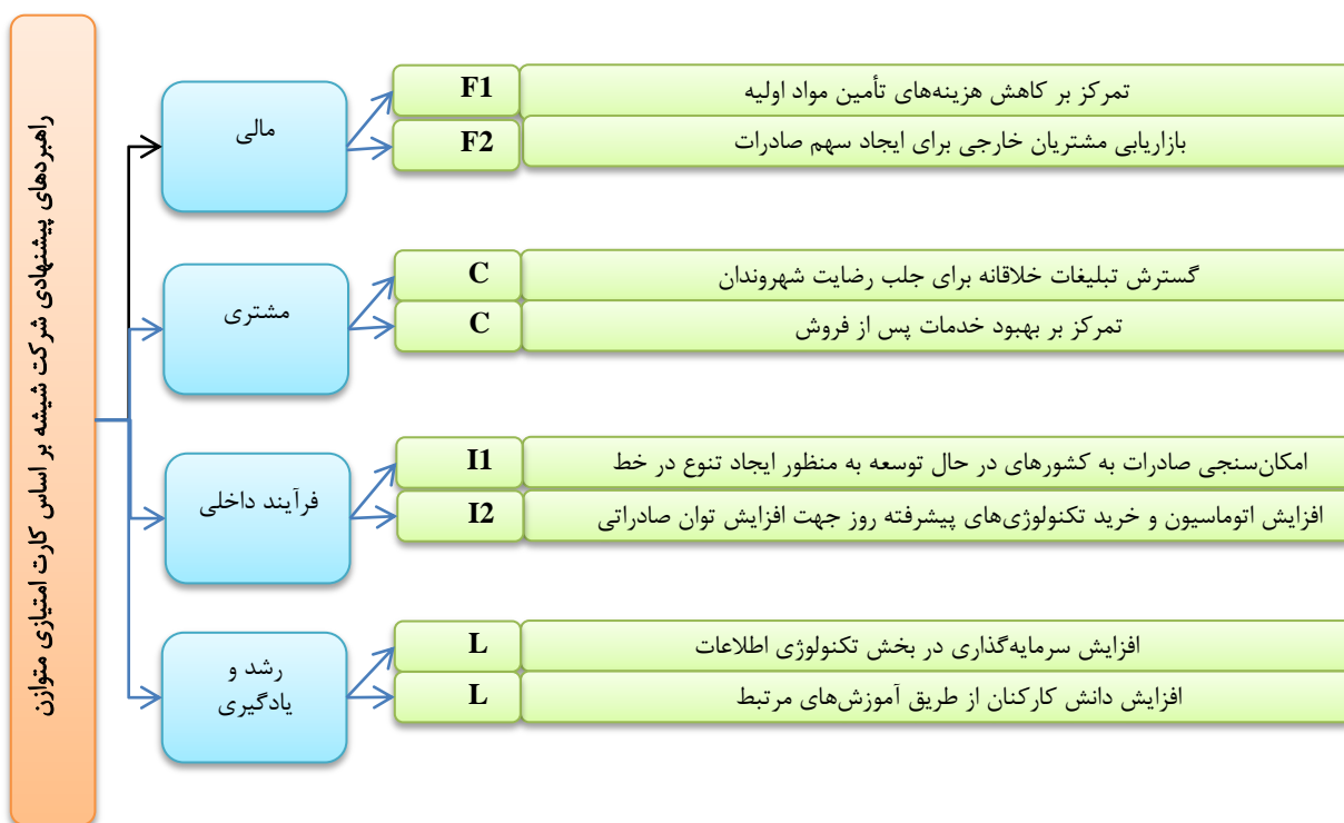
شکل ۲. راهنمادهای پیشنهادی شرکت شیشه بر اساس کارت امتیازی متوازن

سپس جدول ۱ در اختیار کارشناسان قرار گرفت و از آن‌ها خواسته شد در صورت تأثیرگذاری یک استراتژی از استراتژی دیگر، در خانه مربوطه، تأثیرگذاری را با علامت ستاره مشخص کنند که در نهایت جدول وابستگی بین استراتژی‌های وجوه مختلف ماتریس کارت امتیازی متوازن به صورت زیر درآمد: